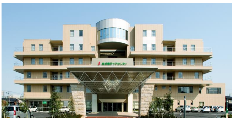
金沢市元菊町 20 番 1 号 金沢春日ケアセンター内 1 階相談課

ご高齢者ご本人やご家族の希望、心身のご状態や生活環境などを総合的に考慮し安心した生活が送れるようにお手伝いを致します。